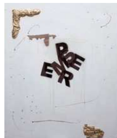
Stefano Torrielli - E Sempre e per sempre first - 2012-(Tecnica mista su tela ( resina, acrilico)120x100cm [Vedi la foto originale])

GALLERIA SABRINA FALZONE vai alla scheda di questa sede Exhibart.alert - tieni d'occhio questa sede Via Giorgio Pallavicino 29 (20145) mostre@sabrinafalzone.info www.galleriasabrinafalzone.com individua sulla mappa Exisat individua sullo stradario MapQuest Stampa questa scheda Eventi in corso nei dintorni